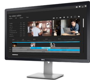
Dell UltraSharp Ultra-HD- 4K-Monitor mit PremierColor | UP3216Q